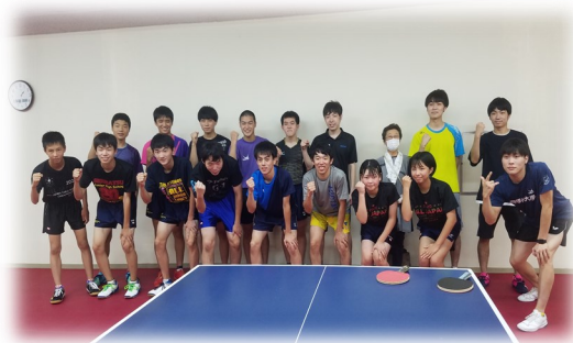
★産附高校生参加！FAVOでの一日開放

楽しい夏休みのイベントもなかなか味わえなかった今年 の夏ですが、 おうち時間を過ごす中で皆さんはどんなことを考えていましたか？ やっぱり オリンピック・パラリンピック のことですか？それとも 練習のこと ですか？